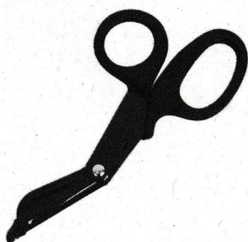
メディカルシェアーズ