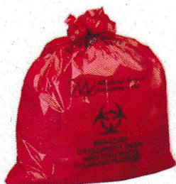
バイオハザード ディスプレイザブルバッグ